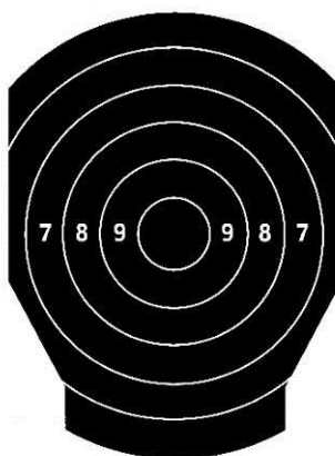
100 + 200 m HLAVA S KRUIHY