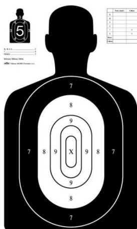
300 m Figura FBI