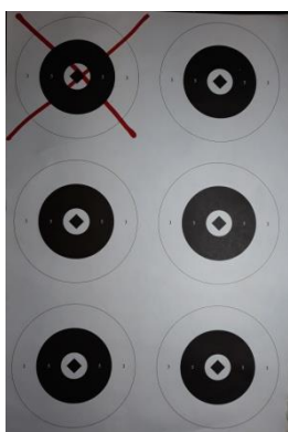
100 m – opakovací pušky